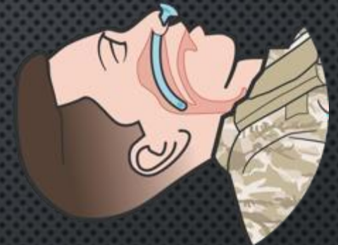
Atemwegsverletzung / Atemwegsverlegung